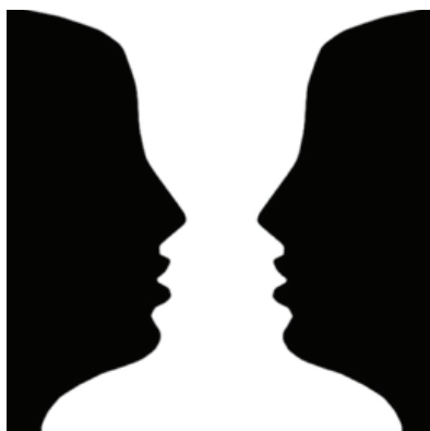
Illusione ottica del vaso-volti