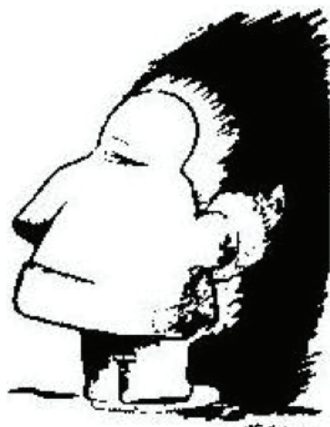
Illusione ottica dell'indiano-eschimese