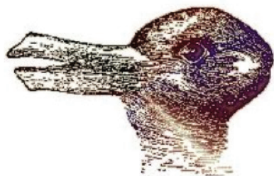
Illusione ottica del coniglio-papero