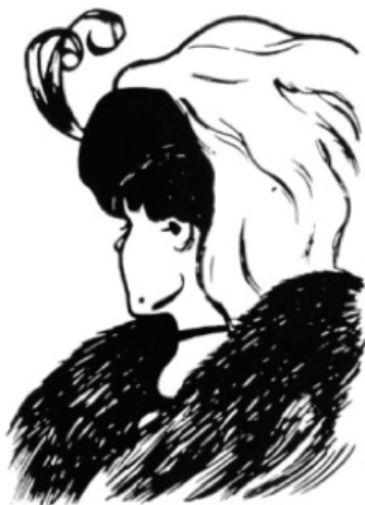
Illusione ottica della vecchia-giovane